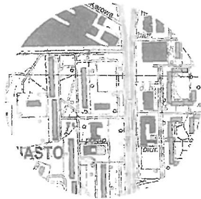
szkic orientacyjny skala 1:10 000